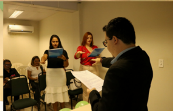
Cerimônia de Posse das(os) novas(os) servidores do CRP-11